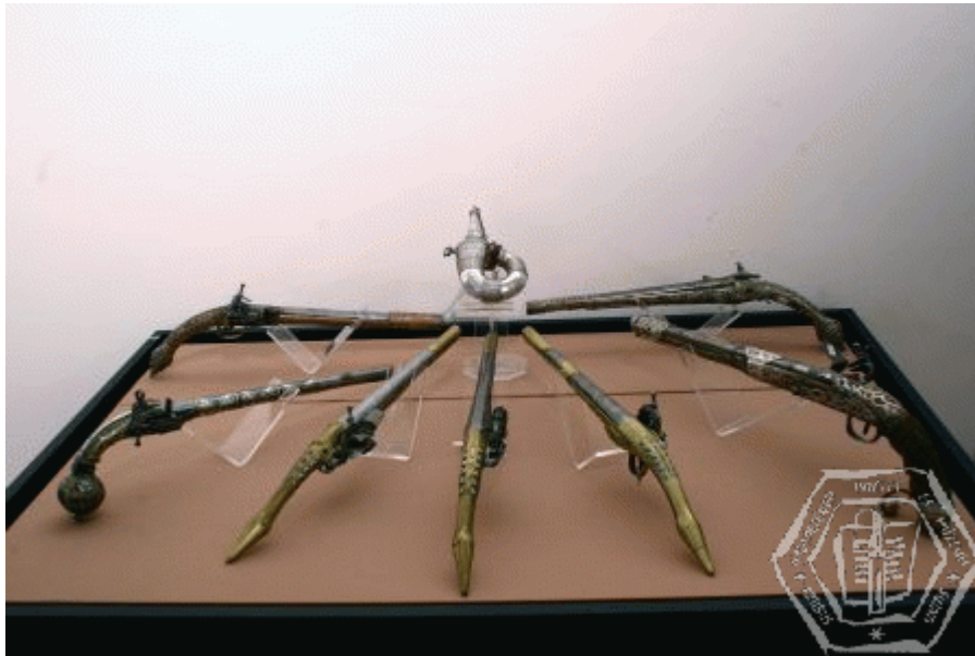
Hadtörténeti Múzeum –török korabeli puskák