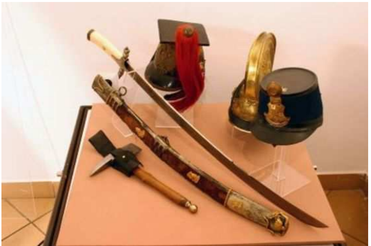
Hadtörténeti Múzeum –török korabeli fegyverek