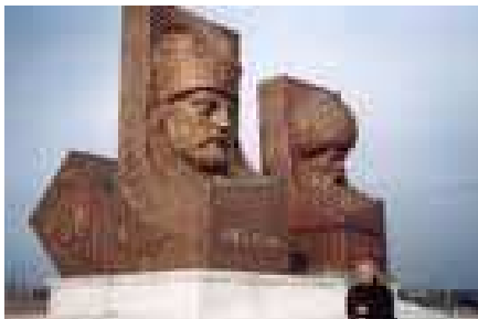
7. Metin Yurdanur : Zrínyi Miklós és Szulejmán szultán (1994. Szigetvár)