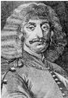
2. J. Th. G. Boutatas metszete 1664