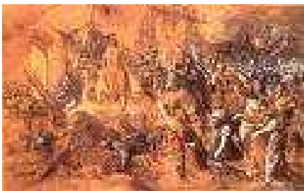
10. A várvédő Zrínyi