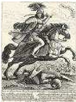
3. korabeli metszet a költőről