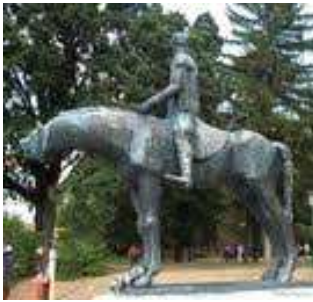
9. Somogyi József: Zrínyi Miklós (1968. Szigetvár)