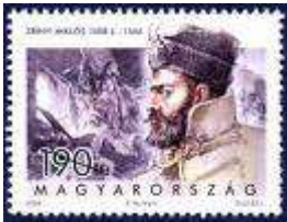
5. szerző ismeretlen - Zrínyi Miklós