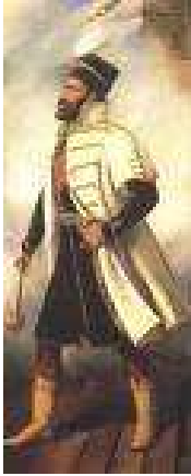
1. Barabás Miklós: Zrínyi Miklós (1842)