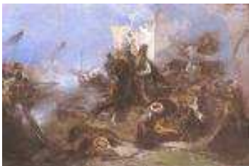
6. Hollósy Simon: Zrínyi kirohanása. 1896, olaj, vászon