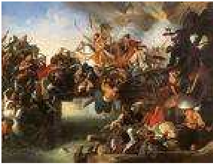
4. Johann Peter Kraft: Zrínyi kirohanása (1825)